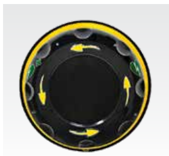
Настенный шкафчик Rotaid Solid Plus Heat с подогревом и системой подачи сигналов тревоги Для использования на улице. 11996-000450 (зеленый) 11996-000449 (белый) 11996-000451 (красный) 11996-000452 (желтый)