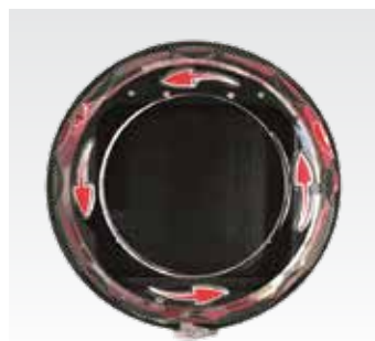
Настенный шкафчик Rotaid Plus с системой подачи сигналов тревоги Для использования в помещении. 11996-000442 (зеленый) 11996-000441 (белый) 11996-000443 (красный) 11996-000444 (желтый)