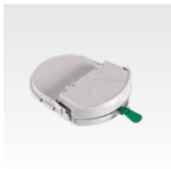
Картридж Pad-Pak для взрослых С сертификатом TSO/ETSO-C142a для использования на борту воздушного судна. PAD-PAK-07