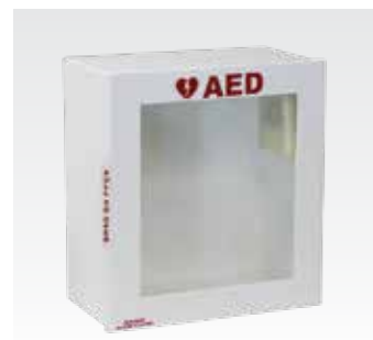
Настенный шкафчик с системой подачи сигналов тревоги, изготавливается по индивидуальному заказу Размеры: 30,48 x 27,94 x 12,7 см (12 x 11 x 5 дюймов) (В x Ш x Г) Вес: 2,27 кг (5 фунтов) PAD-CAB-04