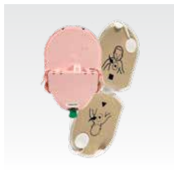
Картридж Pediatric-Pak Для пациентов в возрасте от 1 года до 8 лет или весом до 25 кг (55 фунтов) PAD-PAK-04