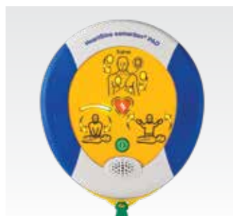
HeartSine samaritan PAD Учебный дефибрилятор SAM 500P TRN-500-XX*