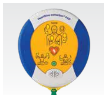
HeartSine samaritan PAD Учебный дефибрилятор SAM 350P TRN-350-XX*