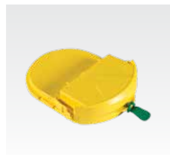
Картридж Trainer-Pak (с запасными электродами) TRN-PAK-04