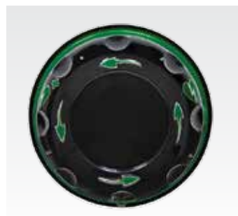
Настенный шкафчик Rotaid Solid Plus с системой подачи сигналов тревоги Для использования в помещении и на улице. 11996-000446 (зеленый) 11996-000445 (белый) 11996-000447 (красный) 11996-000448 (желтый)