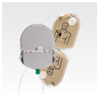
Картридж Pad-Pak для взрослых Для пациентов старше 8 лет или весом более 25 кг (55 фунтов) PAD-PAK-03