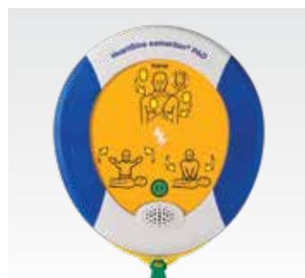
HeartSine samaritan PAD Учебный дефибрилятор SAM 360P TRN-360-XX*