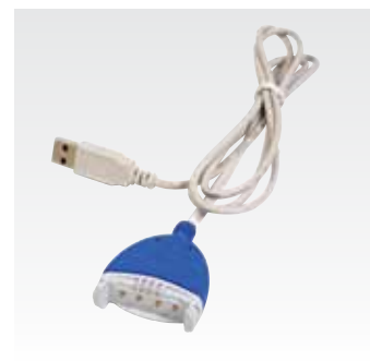
USB-кабель для передачи данных Используется с программой управления данными Saver EVO для загрузки данных о событиях на устройстве, не подсоединенные к дефибрилятору HeartSine samaritan PAD, и обновления их программного обеспечения. PAD-ACC-02